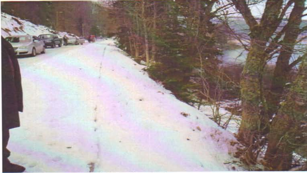
Resim 1. Alanda gereğinden fazla yapılan yol dolgusu