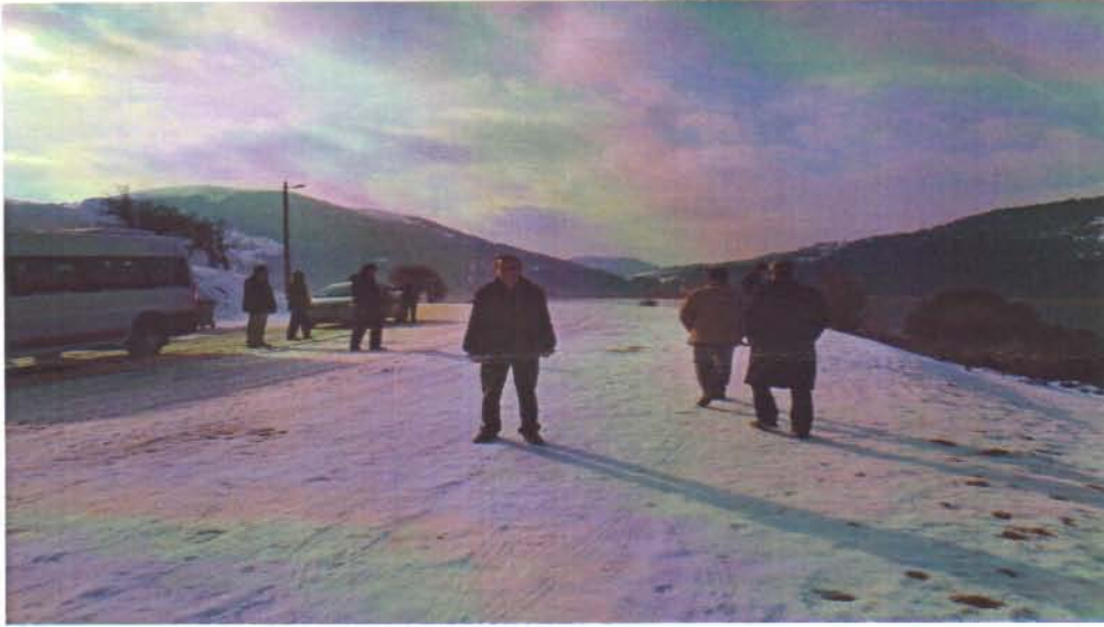
Resim 2. Plana uygun olmayan yol genişletmesi