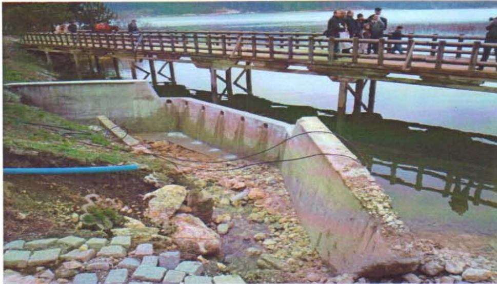
Resim 6: Abant'ın su boşaltımı önüne konulan ve göl seviyesini 2 m yükselten, daha sonra da kaldırılan set (savak). (18.04.2010)