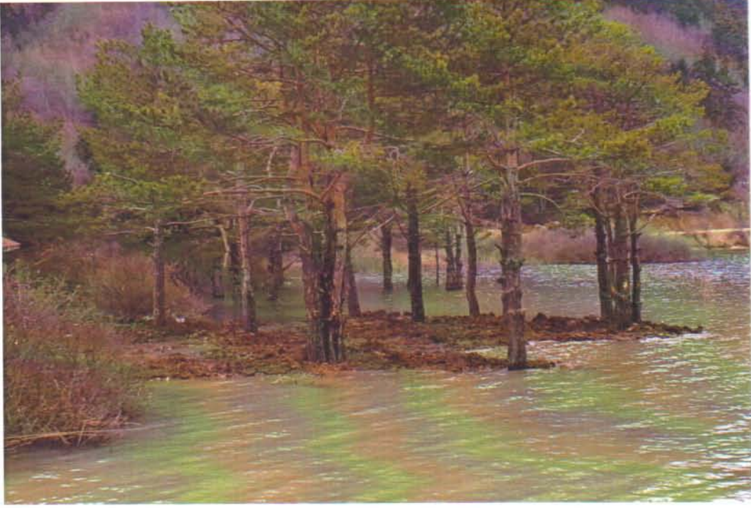
Resim 7: Gölün yükseltilmesi sonucu su altında kalan piknik alanı ve ağaçlar. (Toprak sonradan dökülmüştür) (18.4.2010)