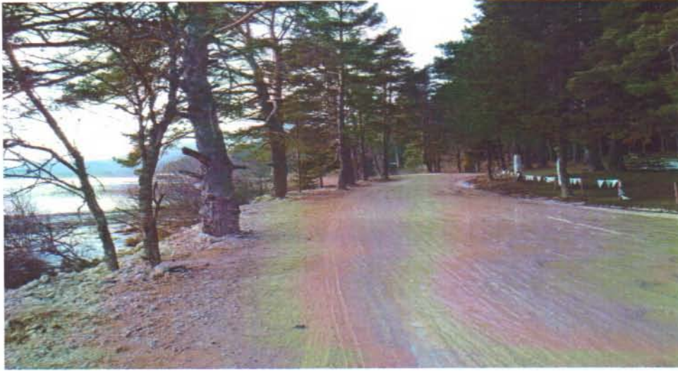
Resim 5. Yol dolgusu ve genişletmesi sonucunda kök boğazı toprak altında kalan ağaçlar