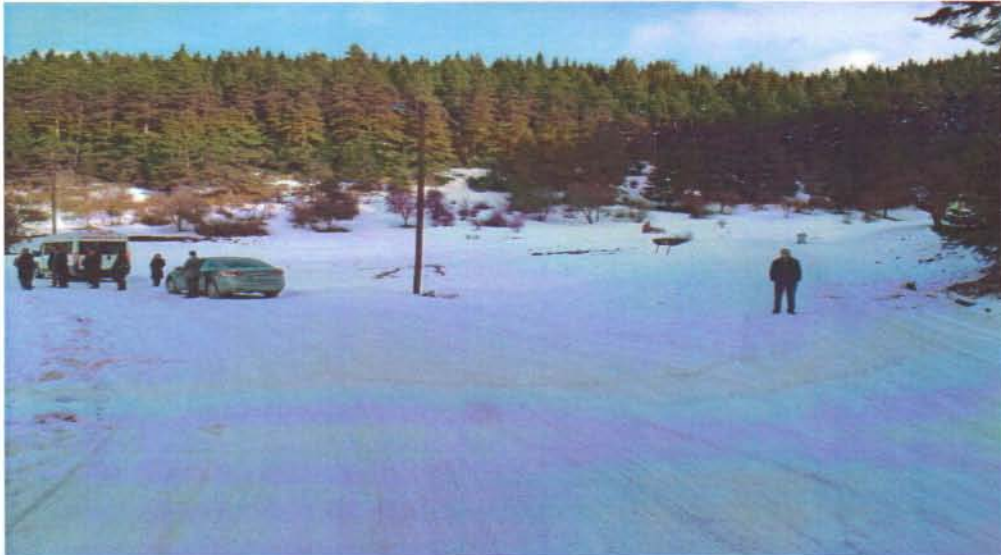
Resim 3. Araçların durduğu yol planda olmayan yeni açılan yoldur.